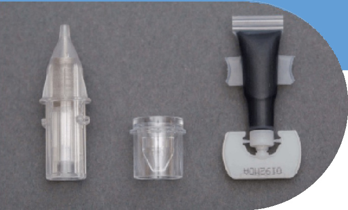
Aguja de seguridad, vaso de tinta, pigmento